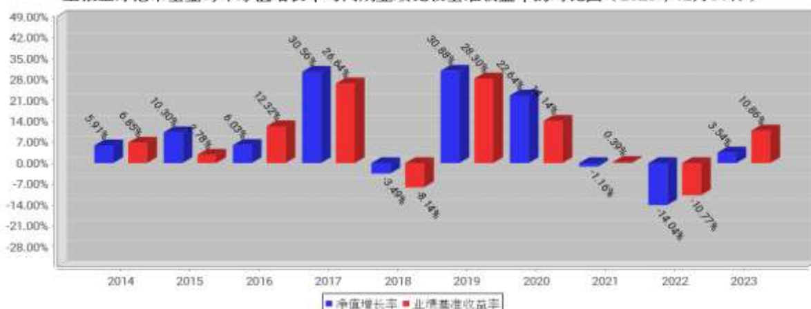
工银全球港币基金每年净值增长率与同期业绩比较基准收益率的对比图（2023年12月31日）

注：1、本基金基金合同于 2008 年 2 月 14 日生效。合同生效当年不满完整自然年度的，按实际期限计算净值增长率。